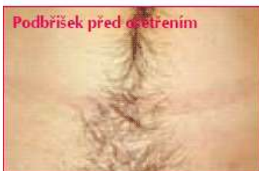
Podbříšek před ošetřením